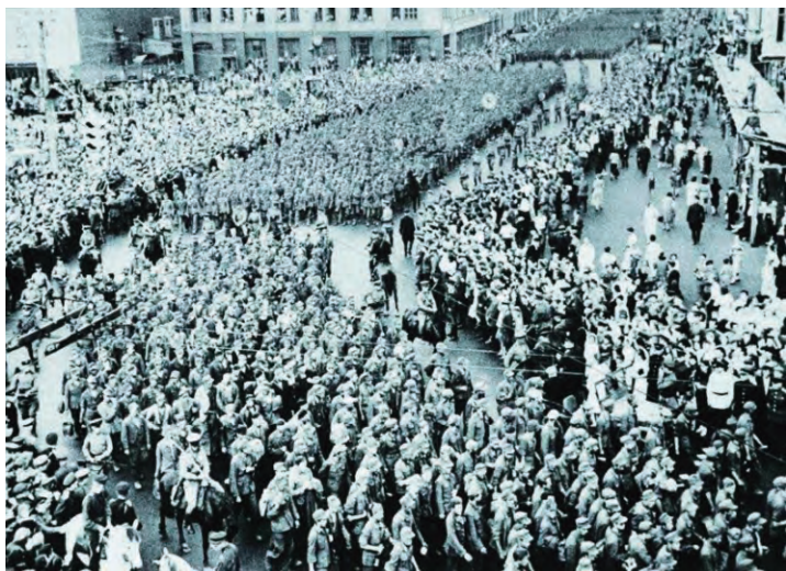
德军战俘在苏联莫斯科接受“检阅”